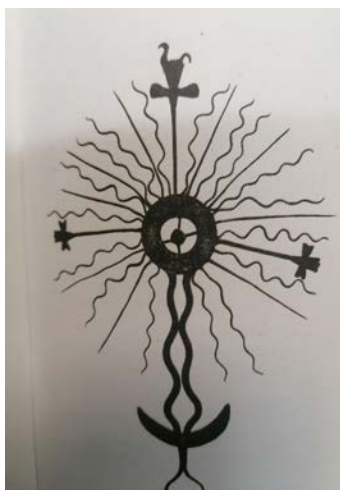
3 pav. Paminklo viršūnė. Ukmergės raj. 1967. Nr. 462. Iš kn. (LLM III, 1992)