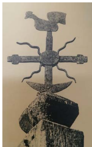
4 pav. Kapinių paminklo viršūnė. Šventėžeris. Lazdijų raj. 1968. Iš kn. (LLM III, 1992)