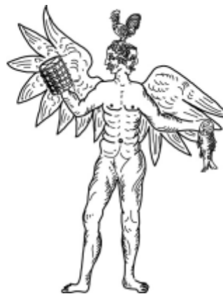
1 pav. Wejopattis. Piešinys tušu rankraštyje: Matthaeus Praetorius. Deliciae Prussicae, oderPreussische Schaubühne. Federzeichnung im vierten Buch Idoloatria veterum Prussorum. Publikuotas: Pretorijus, 2006

dys. Vėjopatis ypač garbintas esant audringam orui. M. Pretorijus dar pridėda plunksna pieštą Vėjopačio atvaizdą ir spėja, kad tokia skulptūra senaisiais laikais galėjo būti statoma Perdoitui ( Perdoytas ).