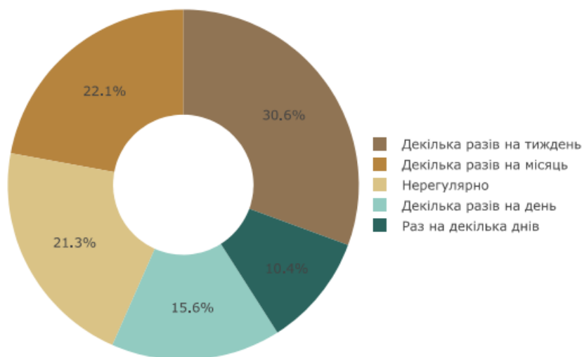
Скриншот 2. Частотність використання медіа РФ виразу «Донбас і Новоросія»